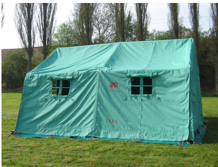
Tente SNJ :