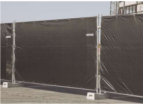
Barrière Heras :